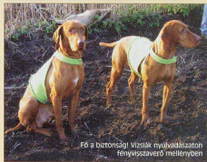
Fő a biztonságról! Vizslák nyúl-vadászaton fényvisszaverő mellényben

A nagycsoportos társas vadászat nemcsak a kutyáiktól, de a vadászoktól és a hajtóktól is fokozott figyelmet, fegyverzettséget követel meg a bal-estmentes és sikeres vadászat érdekében. Az ilyen vadászat