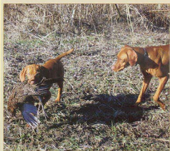
Négy hónapos kölyök anyai felügyelettel fáciant apportíroz.

A kutyáknak ilyenkor csakis lövés utáni feladataik vannak, azaz a lött vad elhozása és a sebzett madár utánkeresése,