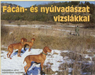
Vadszedésre várva nagyterítékes vadászaton

Fegyvelmeztelen, folyton előrohanó, a madarakat idejekorán felverő vizsla viszont tönkreteszi a vadászatot. Egy-egy előrohanást még elnéznek a vadászok, de ha sorozat-